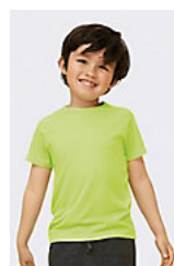
SOL'S SPORTY KIDS 01166