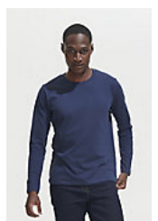
SOL'S Imperial LSL MEN