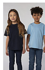
SOL'S Imperial KIDS 11770